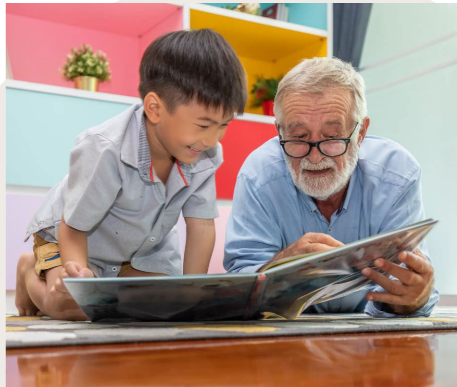
Table-ronde dans le cadre des Rendez-vous des bibliothèques publiques du Québec, 2-3 mai 2024

Agent.e d'animation et de formation, Intergénérations Québec