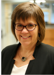
TABLE RONDE AVEC